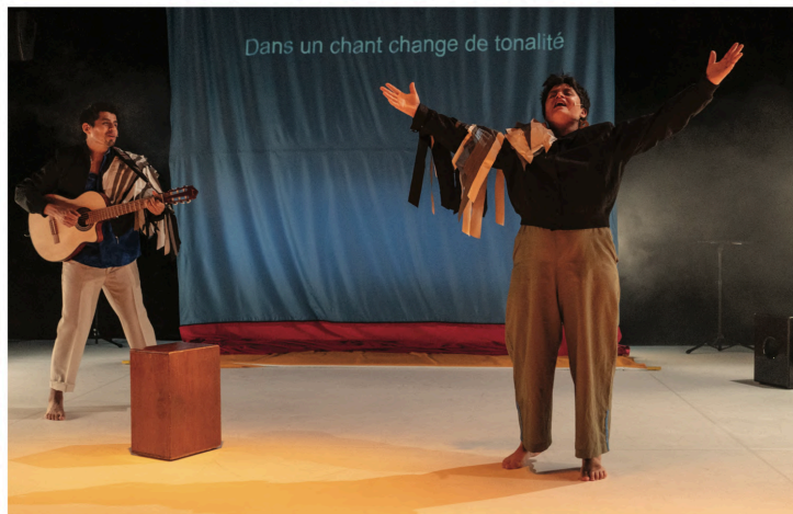
«Recordar, c'est vivre à nouveau» est un spectacle à fleur de peau qui pose la question essentielle de la mémoire.

Le duo qu'ils forment dans cette autofiction où ils jouent à être eux-mêmes part de l'histoire familiale, intime et personnelle, avec des moments à la fois drôles et émouvants, pour